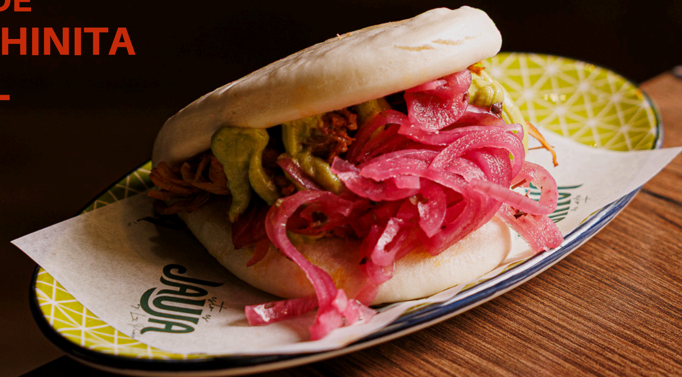
BAO DE COCHINITA PIBIL